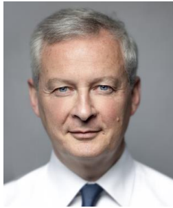
Bruno Le Maire Ministre de l'Économie, des Finances et de la Souveraineté industrielle et numérique

« Nous avons l'immense chance, en France, de bénéficier d'un écosystème de startups innovantes et dynamiques, dans la deeptech, l'industrie verte, les services.