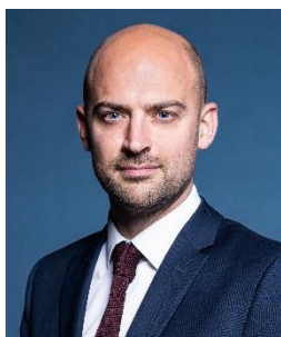
Jean-Noël Barrot Ministre délégué, chargé du Numérique

« La French Tech fête ses 10 ans cette année. Nous pouvons nous féliciter du chemin parcouru depuis 2013 où tout un écosystème restait encore à bâtir. Sous l'impulsion du Président de la République et grâce au travail et à la passion des entrepreneurs français, la French Tech rayonne dans notre pays et à l'international. Durant ces dix années, nous sommes parvenus à faire de la France un des pays les plus attractifs au monde pour les start-ups qui veulent se lancer, partir à la conquête des marchés internationaux et créer un avenir qui ait du sens.